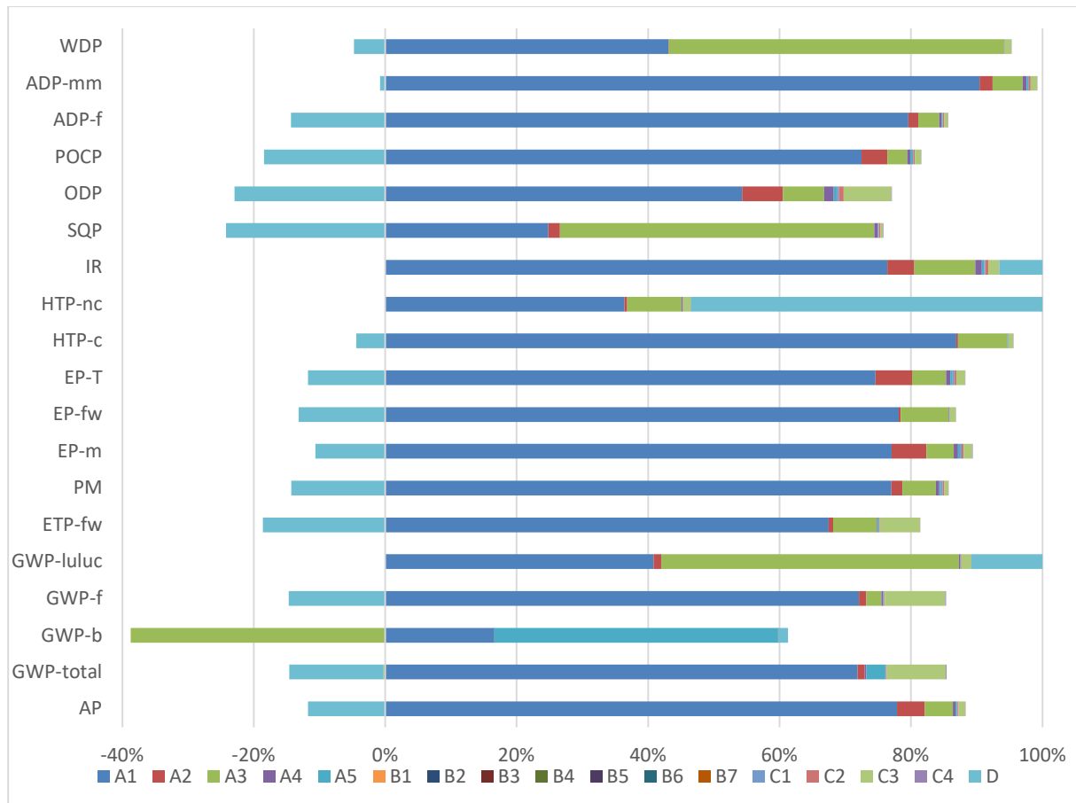
Abbildung 3: Überblick über den Einfluss jeder Phase pro Umweltauswirkungskategorie (in %)

Die folgende Abbildung zeigt den Einfluss der einzelnen Phasen auf die Umweltauswirkungen in Prozent.