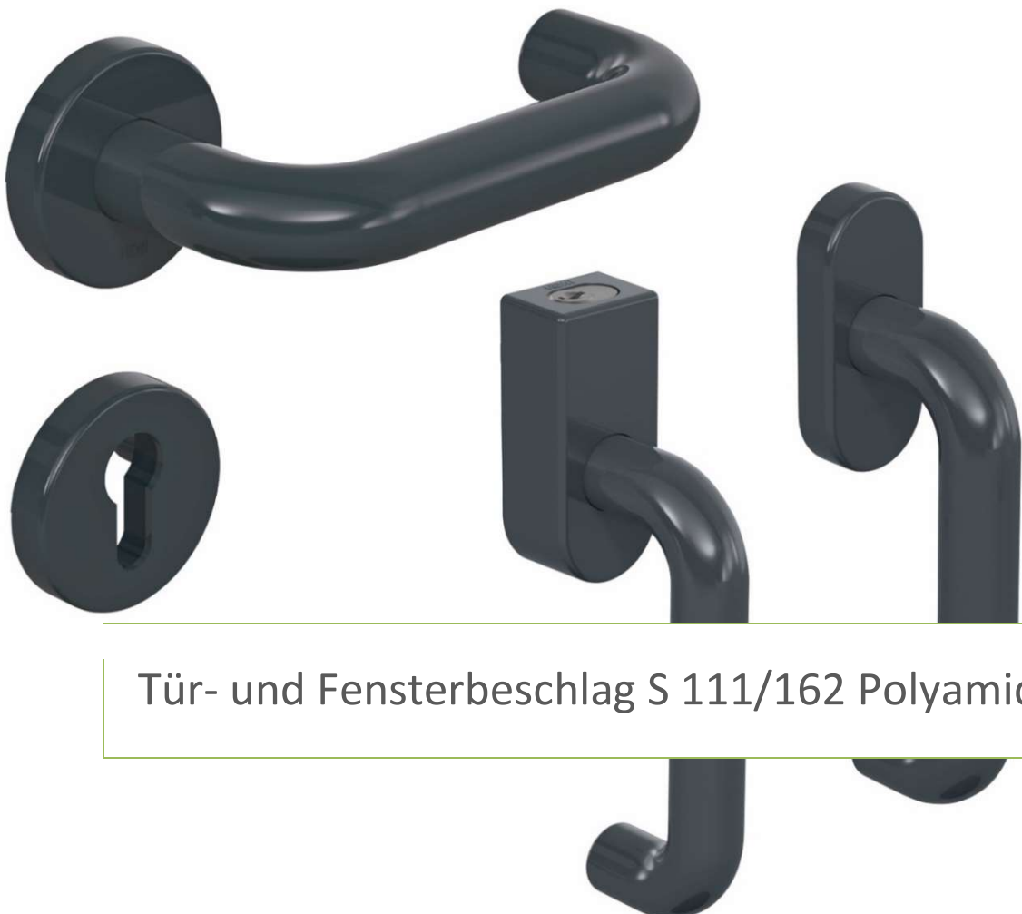
Tür- und Fensterbeschlag S 111/162 Polyamid