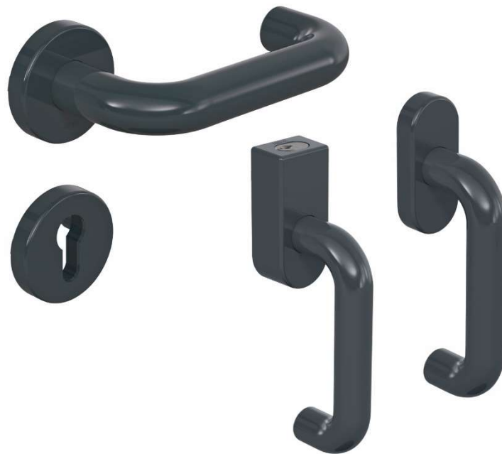
Abbildung 1: Tür- und Fensterbeschlag S 111/162 Polyamid von HEWI Heinrich Wilke GmbH

Der "Tür- und Fensterbeschlag S 111/162 Polyamid" der HEWI Heinrich Wilke GmbH (siehe Abbildung 1) in R-Technik mit Rosetten ist aus dem Werkstoff Polyamid nach DIN 18255, EN 1906, DIN EN 179 und DIN 18273 gefertigt.